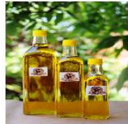
Cam Sise Zeytinyağı 0,5lt