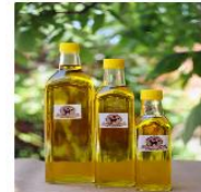
Cam Sise Zeytinyağı 1Lt